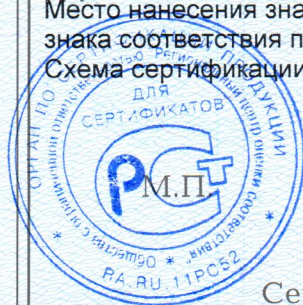
Схема сертификации 3, инспекционный контроль 1 раз в год.

Место нанесения знака соответствия – в товаросопроводительной документации, графическое изображение знака соответствия по ГОСТ Р 50460-92 с надписью «Добровольная сертификация».